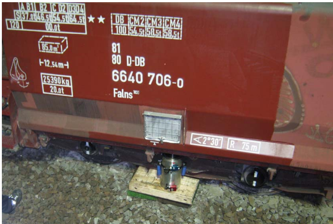
Abbildung 1: entgleistes Drehgestell in Fahrrichtung des Zuges – rechte Seite -

* Vollbremsung _____ = höchstmögliche Bremskraft – Druckabsenkung auf 3,5 bar