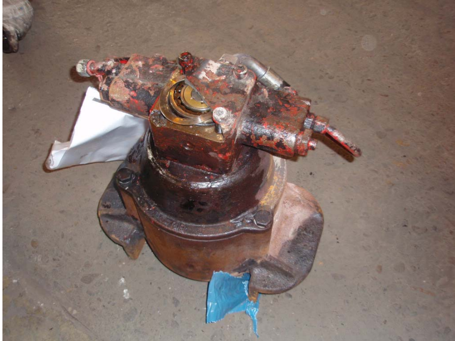
Abbildung 2: Wellenschenkelstumpf mit Radsatzlager und angebaute Pumpe

Druckkappe ist nicht mehr zweifelsfrei erkennbar sowie keine Ausbröckelungen am Außenring, die ursächlich hätten zum Lagerschaden führen können.