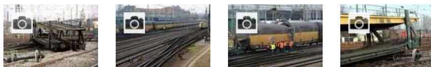
Fotostrecke: Zug entgleist am Bremer Hauptbahnhof

Nach dem Bericht der Unfallexperten war bei einem Transportwaggon für Autos die Bremse fest angezogen gewesen. Mindestens ein Radsatz habe während der gesamten Fahrt des Zuges, er kam aus Cuxhaven, immer wieder blockiert. Das hätten Abdrücke auf den Schienen belegt. In Bremen habe der Zug erst halten, dann wieder anfahren müssen. Beim Beschleunigen sei der Waggon schließlich mit Tempo 50 aus den Schienen gesprungen.