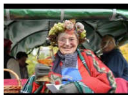
ELTVILLE Rheingauer Winzer präsentieren sich beim Herbstschluss-Umzug in Eltville