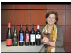
ELTVILLE Zwillingsweingut in Israel