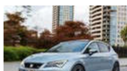
Der SEAT Leon. Einer, der überall gut ankommt: der SEAT Leon.