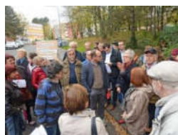
NACHRICHTEN WIESBADEN Diskussion um Nachverdichtung: Rundgang der Bürgerinitiative durch den